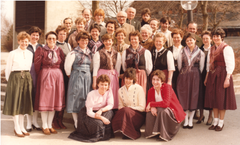
Der Kirchenchor im Jahr 1985

Zusammen mit den sehr aktiven Schrobenshausener Volksmusikanten durften wir 1985 die Schallplatte „Schrobenshausener Hoagarten“ aufnehmen. Für uns eine ganz andere Musikrichtung und eine neue Erfahrung.