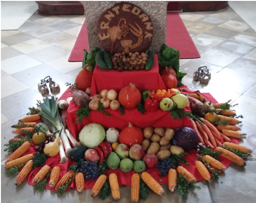
Erntedankaltar in St. Mauritius Edelshausen