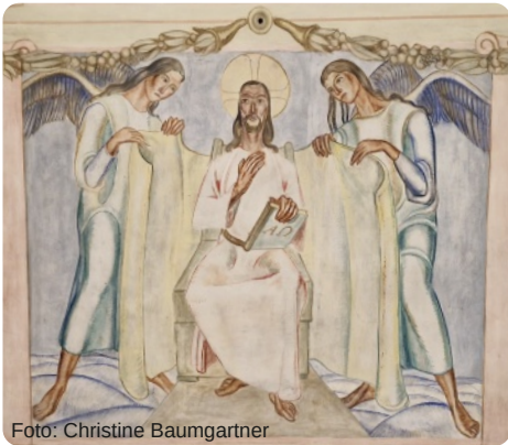
Jesus als Herr und Richter der Welt im Deckenfresko der Pfarrkirche St. Mauritius in Edelshausen

Monsignore, Prälät, Pfarrer, Bischof, Papst ... Das sind nur ein paar Beispiele für Titel, mit denen Geistliche angesprochen werden. Und viele fragen sich: Was bedeuten sie? Und was soll das überhaupt? Brauchen wir so was in der Kirche? Die Antwort auf diese Fragen müsste ziemlich eindeutig ausfallen, wenn wir daran denken, was Jesus im Rahmen der Wehe-Rufe gegen die Schriftgelehrten und Pharisäer sagt: „Ihr aber sollt euch nicht Rabbi nennen lassen; denn nur einer ist euer Meister, ihr alle aber seid Brüder.“ (Mt 23,8) Und wer der Meister ist, auch das sagt Jesus deutlich bei der Fußwaschung am Gründonnerstag: „Ihr sagt zu mir Meister und Herr und ihr nennt mich mit Recht so; denn ich bin es.“ (Joh 13,13) Ein Titel gebührt nach diesen Worten Jesu also nur ihm selber. Und dieser Titel ist groß: Meister und Herr.